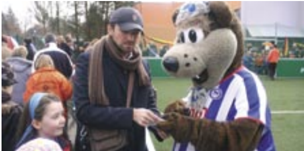
Herthinho, offizielles Maskottchen von HERTHA BSC, musste viele Autogramme schreiben